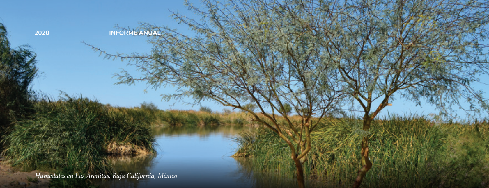
Humedales en Las Arenitas, Baja California, México