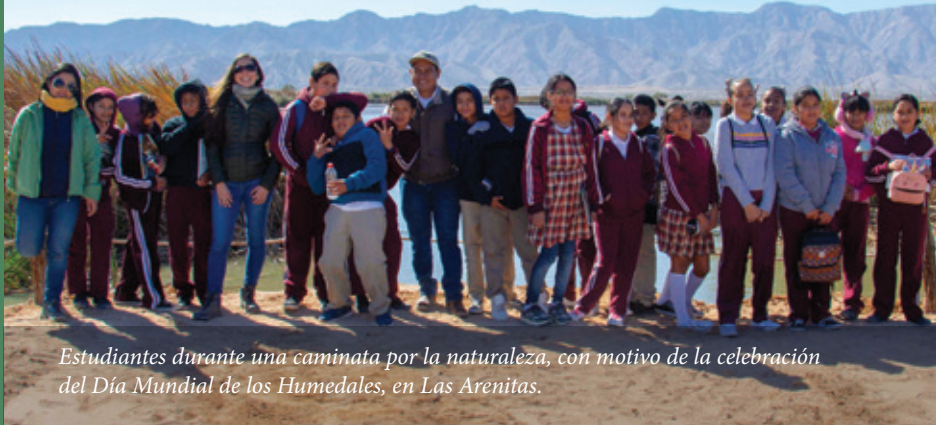
Estudiantes durante una caminata por la naturaleza, con motivo de la celebración del Día Mundial de los Humedales, en Las Arenitas.

Este año nos enfocamos en preparar zonas y cultivar nueva vida mediante la propagación de más de 11,000 plantas nativas, así como regar y cuidar diario a otras 29,000. Algunos de nuestros mezquites más altos pronto podrán ofrecer sombra a los residentes urbanos de Mexicali. Aplicamos nuestra experiencia en restauración de humedales para mejorar paisajes urbanos.