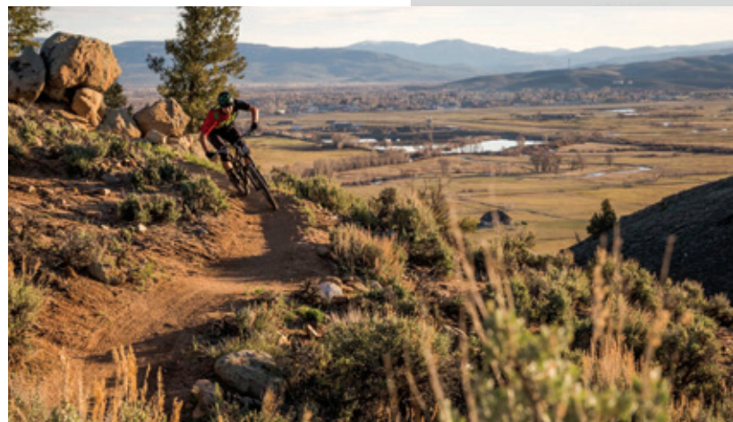
Zona recreativa Hartman Rocks, Condado Gunnison, Colorado