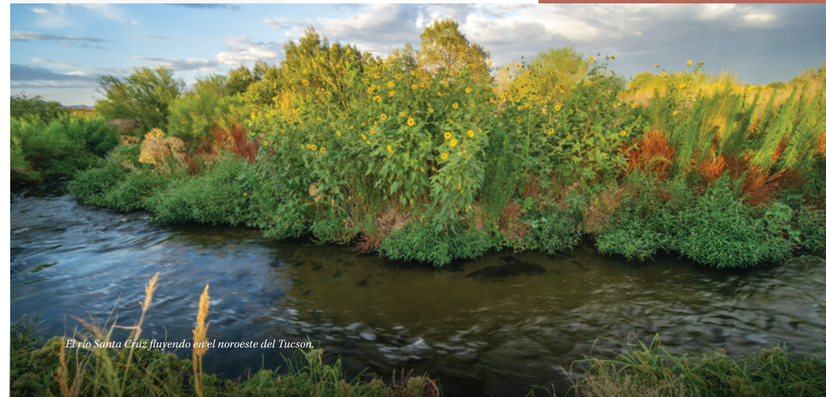
El río Santa Cruz fluyendo en el noroeste del Tucson.