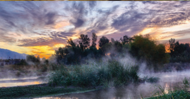
El río Santa Cruz en Marana, AZ.