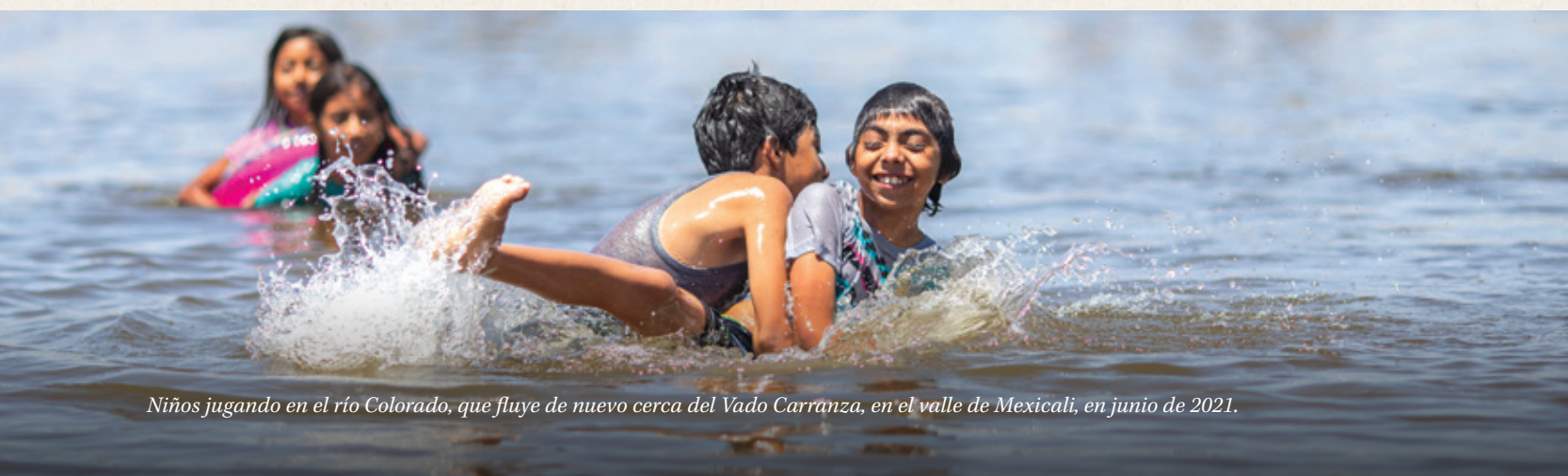
Niños jugando en el río Colorado, que fluye de nuevo cerca del Vado Carranza, en el valle de Mexicali, en junio de 2021.