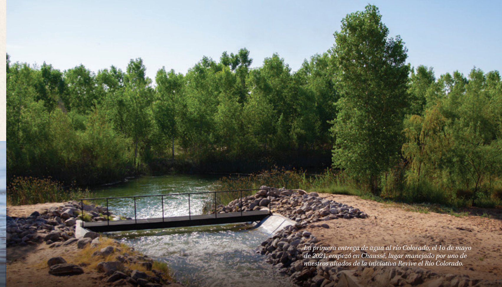
La primera entrega de agua al río Colorado, el 1o de mayo de 2021, empezó en Chaussé, lugar manejado por uno de nuestros aliados de la iniciativa Revive el Río Colorado.