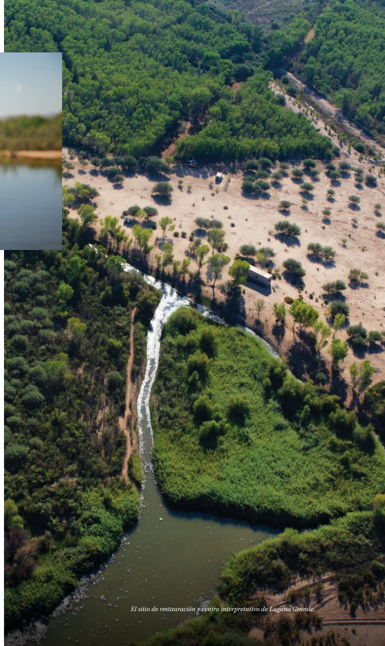
El sitio de restauración y centro interpretativo de Laguna Grande.