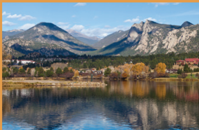
Estes Park, Colorado