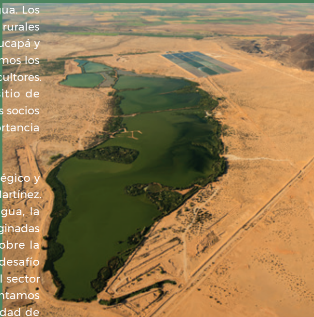
Humedal de tratamiento Las Arenitas

La eliminación de los sedimentos acumulados en el canal principal del río en la zona estuarina permitió que los últimos 80 kilómetros del río fluyeran hasta encontrarse con el mar alrededor de 171 días en 2018, en comparación con los 18 días en el 2011. El número de especies de aves registradas en el estuario aumentó 47% entre 2018 y 2019.