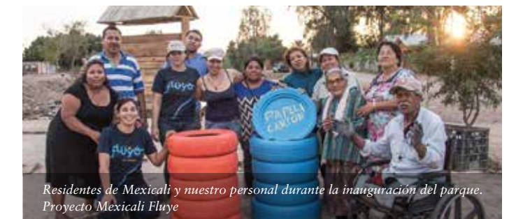
Residentes de Mexicali y nuestro personal durante la inauguración del parque. Proyecto Mexicali Fluye

Las alianzas comunitarias incluyentes fomentarán nuevas ideas y metodologías que documentarán la elaboración de políticas a escala estatal, regional y federal. Juntos seremos fuente de inspiración y motivación para que personas y comunidades planifiquen y asuman un futuro que brinde tanto oportunidades económicas como un medio ambiente saludable que las enriquezca y las sostenga.