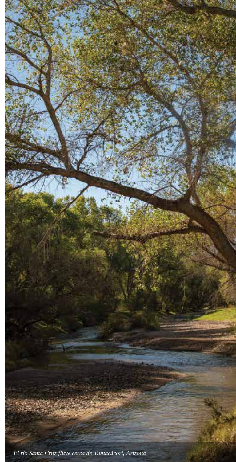
El río Santa Cruz fluye cerca de Tumacácori, Arizona

Paseo en kayak en el sitio de restauración Laguna Grande durante los recorridos Sábados Familiares