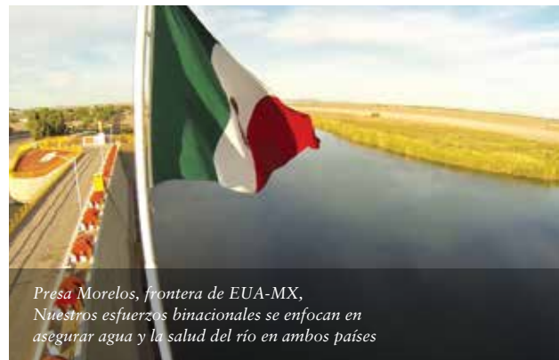
Presa Morelos, frontera de EUA-MX, Nuestros esfuerzos binacionales se enfocan en asegurar agua y la salud del río en ambos países