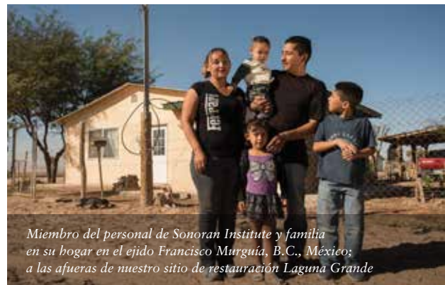
Miembro del personal de Sonoran Institute y familia en su hogar en el ejido Francisco Murguía, B.C., México; a las afueras de nuestro sitio de restauración Laguna Grande