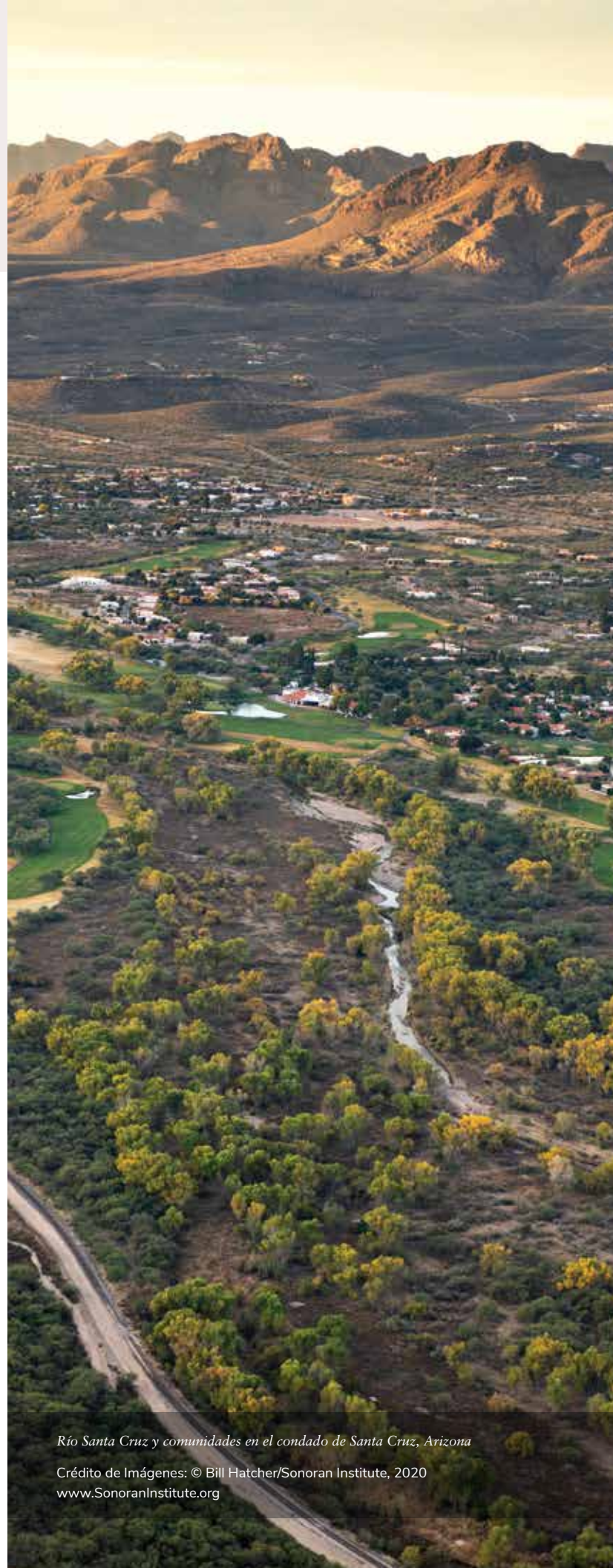
Río Santa Cruz y comunidades en el condado de Santa Cruz, Arizona

Obtendremos financiamiento para inversiones en infraestructura hídrica y de tratamiento de aguas residuales que generarán una mejor calidad del agua y asignarán agua para fines ambientales. Buscaremos ampliar la infraestructura ecológica a fin de reducir de manera cuantificable inundaciones urbanas y efectos tipo islas de calor. Rehabilitaremos además arroyuelos, arroyos y canales urbanos y agrícolas a fin de crear áreas verdes y parques que actualmente no existen.